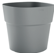
414 Fog Grey