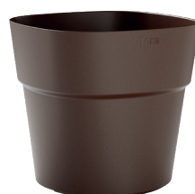
282 Red Amber