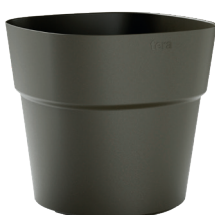
281 Green Hay