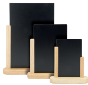
5 6 13