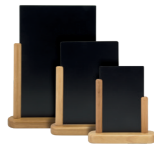
7 8 14