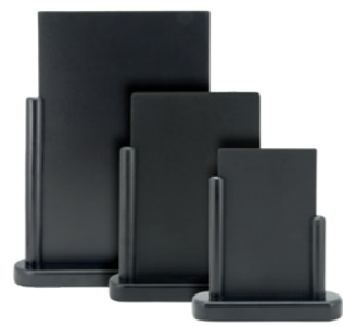
3 4 12